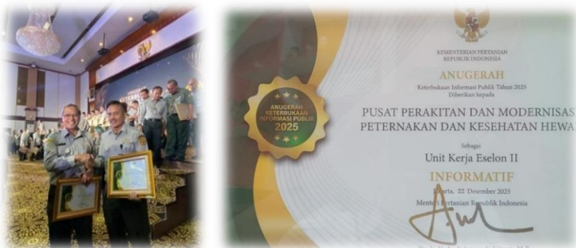
Gambar 5. Penerimaan penghargaan sebagai badan publik yang "Informatif" pada Pemingkatan Keterbukaan Informasi Publik (KIP) lingkup Kementerian Pertanian 2025