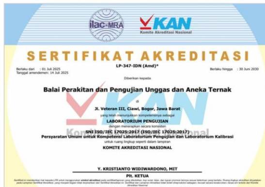
Gambar 4. Sertifikat Akreditasi LP-347-IDN (Amd) BPP Unggas

Sarana laboratorium yang terdapat di BPP Unggas antara lain Laboratorium Pelayanan Kimia. Laboratorium tersebut telah terakreditasi sejak tanggal 23 Maret 2007 dengan No. Sertifikat LP -347-IDN dan mendapatkan akreditasi SNI ISO / IEC 17025. Pada tahun 2025, telah dilakukan reakreditasi pada bulan Januari 2025 dan telah mendapatkan sertifikat yang berlaku hingga 30 Juni 2030. Laboratorium pelayanan kimia dalam praktik kerjanya selalu berkomitmen memberikan pelayanan berdasarkan standar ISO/IEC 17025:2017 dengan tujuan untuk menjamin hasil analisa yang dikeluarkan agar sesuai dengan standar yang berlaku.