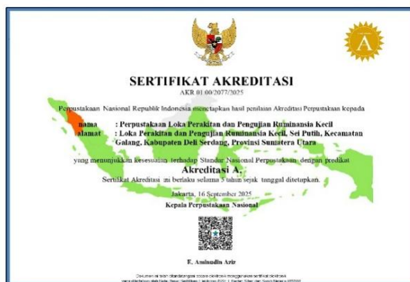
Gambar 9. Sertifikat Akreditasi Perpustakaan LPP Ruminansia Kecil

Di tahun 2025 LPP Ruminansia Kecil juga mendapatkan penghargaan berupa Sertifikat Akreditasi Perpustakaan dari Perpustakaan Nasional Republik Indonesia. Perpustakaan LPP Ruminansia Kecil meraih akreditasi A yang berlaku selama 5 tahun terhitung sejak 16 September 2025. Akreditasi perpustakaan bertujuan untuk menjamin kualitas layanan serta pengelolaan perpustakaan yang berdampak pada peningkatan kepercayaan pemustaka, profesionalisme pengelola, dan citra perpustakaan, serta mendorong pengembangan literasi dan penyebaran informasi. Oleh karena itu, Akreditasi bukan sekadar formalitas administratif tetapi langkah strategis untuk memastikan perpustakaan relevan dan efektif dalam mendukung penyediaan informasi dan pelayanan kepada masyarakat.