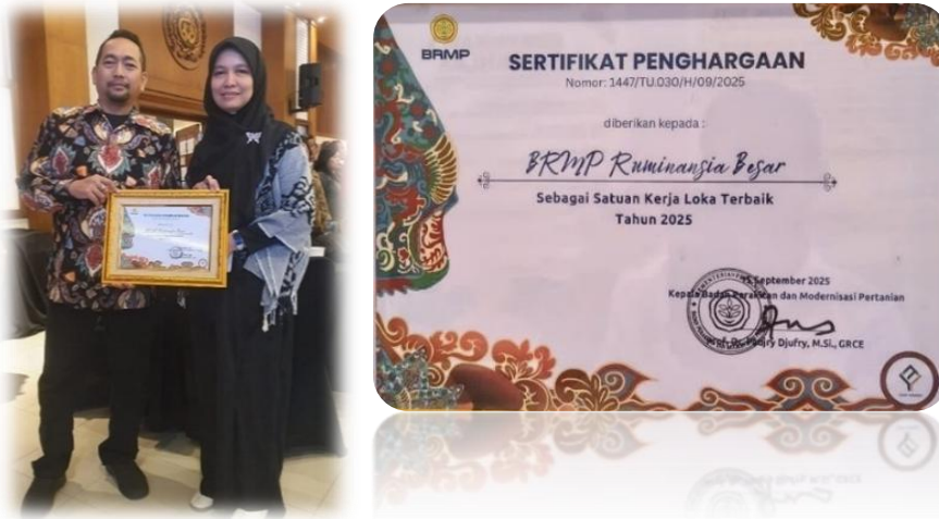
Gambar 10. Sertifikat Penghargaan Satker Loka Terbaik 2025 lingkup BRMP