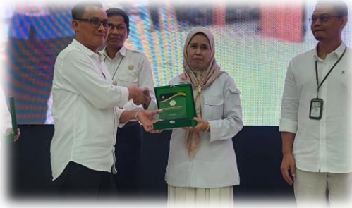
Gambar 8. Penghargaan sebagai Pionir Inpro V6 Tahun 2025

BPP Unggas di tahun 2025 berhasil mendapatkan penghargaan sebagai Pionir Inpro V6 dari Biro Pengadaan Kementerian Pertanian. Inpro V6 merupakan platform pengadaan barang/jasa pemerintah nasional yang dikembangkan oleh LKPP (Lembaga Kebijakan Pengadaan Barang/Jasa Pemerintah) dan dikelola bersama Telkom Indonesia. Platform ini menggantikan sistem lama INAPROC untuk belanja pemerintah yang menawarkan proses yang lebih efisien, transparan, dan terintegrasi.