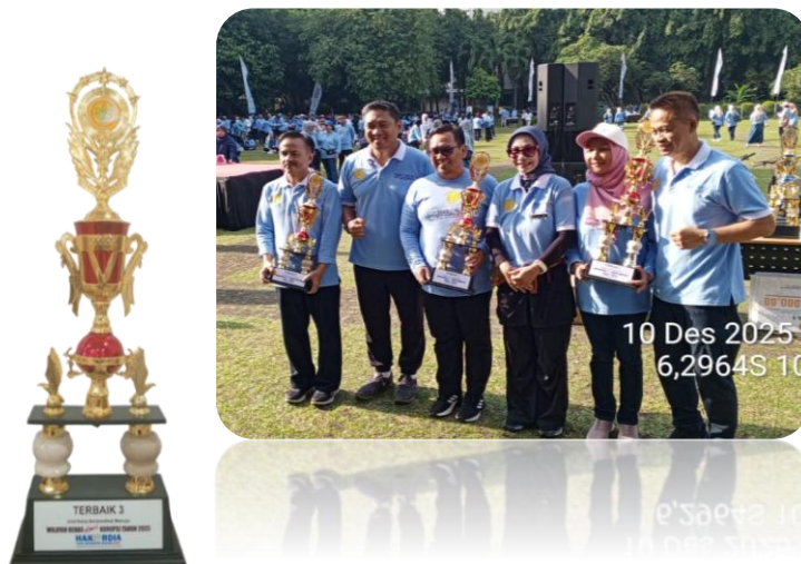
Gambar 6. Penerimaan penghargaan Unit Kerja Berpredikat WBK 2025

PPM PKH berhasil meraih peringkat ke-3 sebagai Satker terbaik berpredikat Menuju Wilayah Bebas dari Korupsi (WBK) lingkup Kementerian Pertanian tahun 2025. Predikat menuju WBK adalah penghargaan bagi unit kerja pemerintah yang memenuhi sebagian besar kriteria pembangunan ZI, mencakup manajemen perubahan, penataan tatalaksana, SDM, akuntabilitas kinerja, pengawasan, dan pelayanan publik, sebagai langkah awal menuju WBBM dengan peningkatan kualitas pelayanan publik. Penghargaan ini merupakan bukti komitmen seluruh elemen organisasi dalam Pembangunan ZI sebagai komitmen pencegahan korupsi dan untuk mencapai satker WBK.