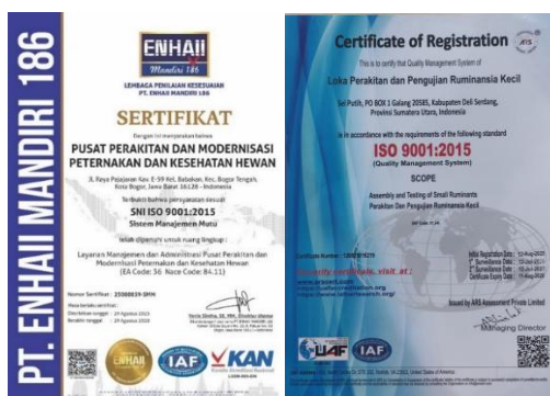
Gambar 3. Sertifikat Sistem Manajemen Mutu ISO 9001:2015 PPM PKH (kiri) dan LPP Ruminansia Kecil (kanan)

Pada tahun 2025 PPM PKH dan LPP Ruminansia Kecil berhasil meraih sertifikasi ISO 9001:2015. Pencapaian ini menjadi bukti nyata komitmen UK dan UPT lingkup PPM PKH dalam menerapkan sistem manajemen mutu secara konsisten dan berkelanjutan. Dalam proses audit, PPM PKH dinilai mampu menunjukkan kinerja positif, meski masih terdapat beberapa catatan observasi yang perlu ditindaklanjuti, khususnya terkait mitigasi risiko dan kelengkapan dokumen. Perwakilan lembaga sertifikasi memberikan apresiasi atas keberanian dan komitmen manajemen PPM PKH yang dinilai memiliki potensi besar untuk terus melakukan perbaikan dan pengembangan. Sertifikasi ini diharapkan dapat menjadi instrumen manajemen untuk meningkatkan tata kelola organisasi, memperkuat integrasi dengan Sistem Pengendalian Intern Pemerintah (SPIP), serta mempersiapkan transisi menuju ISO 9001:2026 yang akan menyesuaikan dengan isu perubahan iklim global.