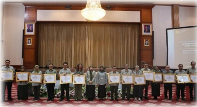
Gambar 7. Penghargaan Kompetisi Inovasi Pelayanan Publik 2025

UPT lingkup PPM PKH berhasil mendapatkan penghargaan dalam Kompetisi Inovasi Pelayanan Publik (KIPP) 2025 yang diselenggarakan oleh KemenpanRB. BBPM Veteriner dan BPP Unggas masuk dalam nominasi mewakili Kementerian Pertanian. BBPM Veteriner mengusung inovasi berjudul "Vaksin VIRDUO AI: Dua Perlindungan Melawan Avian Influenza" sedangkan BPP Unggas mengusung inovasi dengan judul "Janaka Agrinak (Ayam Galur KUB-2)".